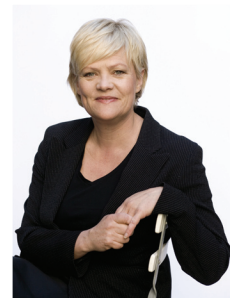
Finansminister Kristin Halvorsen