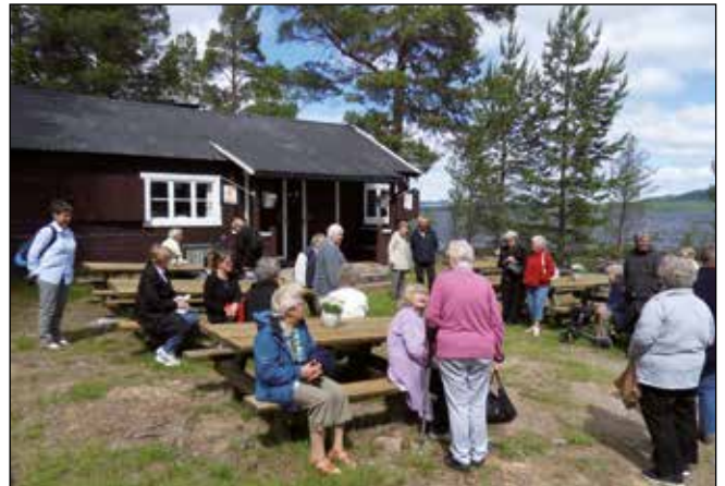
Sørlistøa ved Osensjøen.