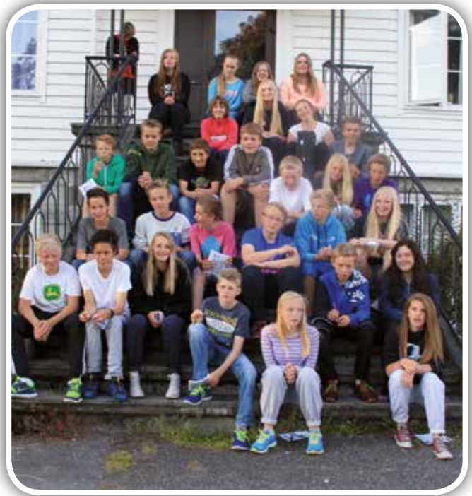
Biletet syner 29 av neste år sine 32 konfirmantar, og er teke under konfirmantleiren på Nordfjord Folkehøgskule.

Konfirmantleir kostar. Eigenandelen for å vere med på leir ligg no på kr. 2 200,-. Signal frå foreldre seier oss at smerteterskelen er nådd. Lom Kyrkjele-