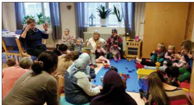
Songstund småbarnstreff.

Det vil bli annonsert kva tid treffan startar oppatt hausten 2015.