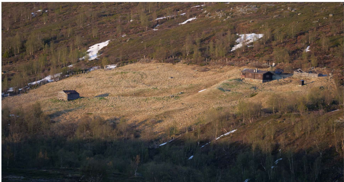
Grafferetra i Svartlia.