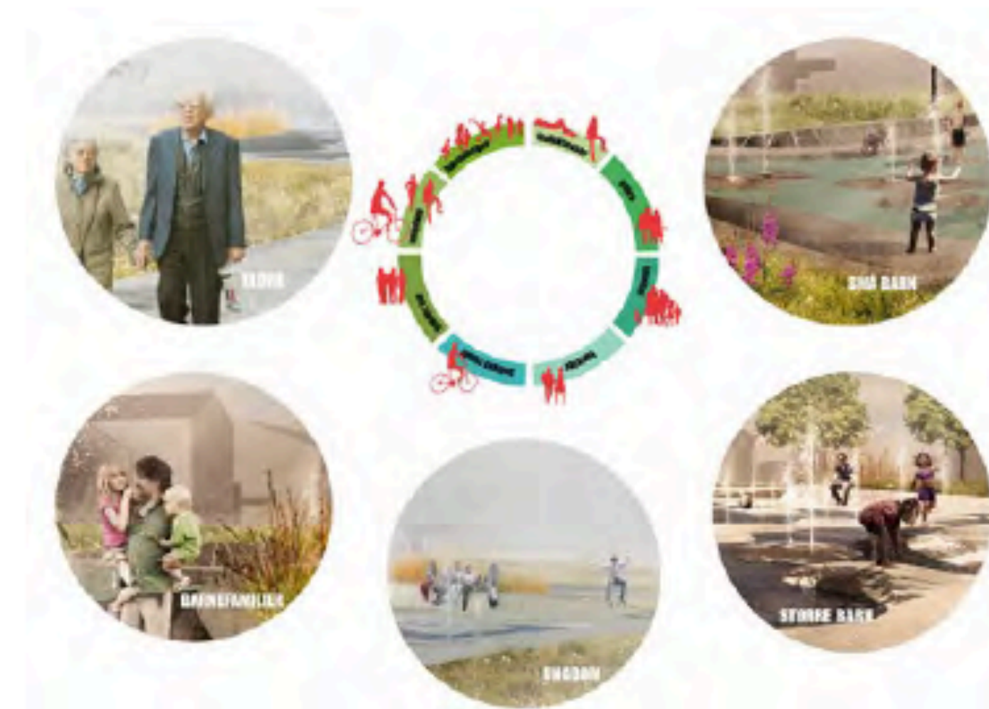
Referanse: Konkurransforslag for St. Marie Plass, Sarpsborg Haugen/Zohar Arkitekter