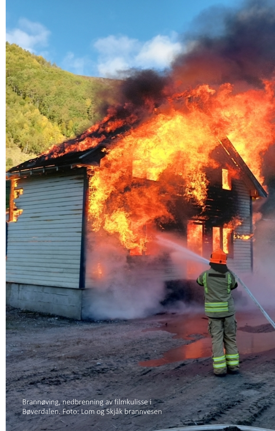
Brannøving, nedbrenning av filmkulisse i Bøverdalen.

I åra framover vil behovet for ei meir systematisk og førebyggjande tilnærming til beredskap auke. Totalforsvars-perspektivet inneber at kommunen må vidareutvikle evna til å handtere både fredstidshendingar og kriser med større kompleksitet. Dette omfattar betre integrering av beredskap i planlegging, styrkt kunnskapsgrunnlag, auka øvingsaktivitet og tiltak som styrkjer eigenberedskap i befolkninga. Evna til å førebygge, handtere og lære av hendingar vil vere avgjerande for å sikre eit trygt og robust lokalsamfunn.