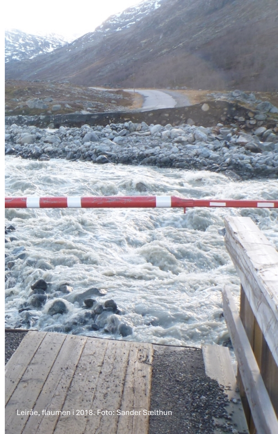
Leiråe, flaumen i 2018.

Den viktigaste påverknadsfaktoren for naturmangfaldet på land er endringar i arealbruk. Inngrep som kvar for seg verker små kan i sum ha ein negativ påverknad på naturmiljøet. Sjølv om Lom har store verna areal så er omsynet til klima og naturmangfald viktig når vi arbeider med arealbruk.