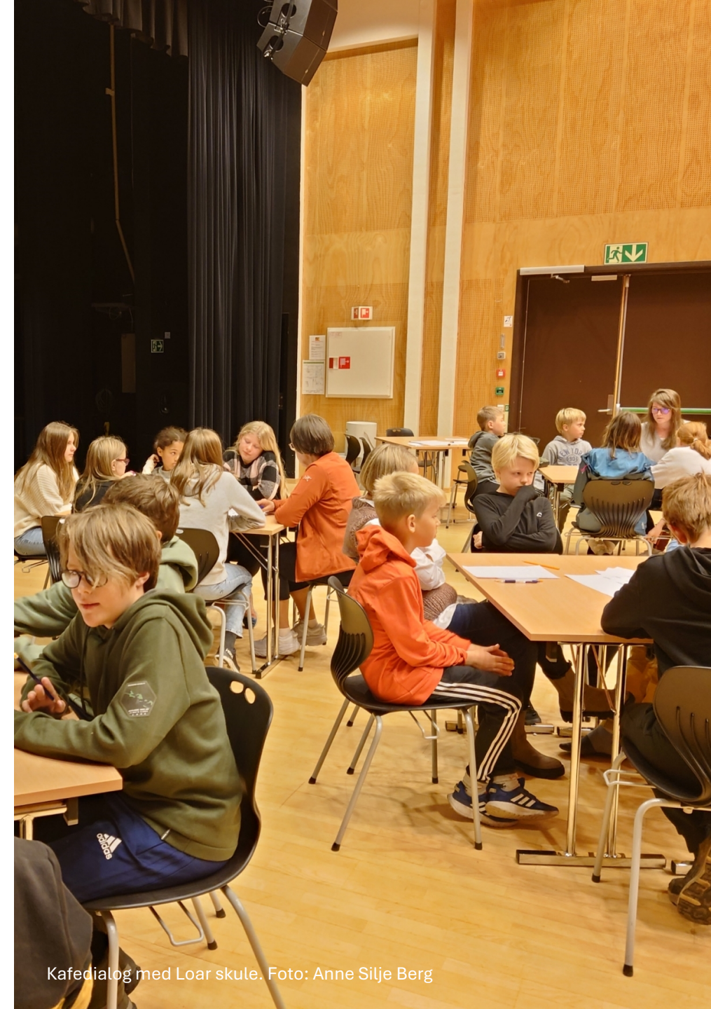
Kafedialog med Loar skule.

Verdien av samfunnsplanen blir redusert dersom ein ikkje involverer resten av lokalsamfunnet. Ved neste hovudrevidering blir det difor igjen lagt opp til breiare medverknad.