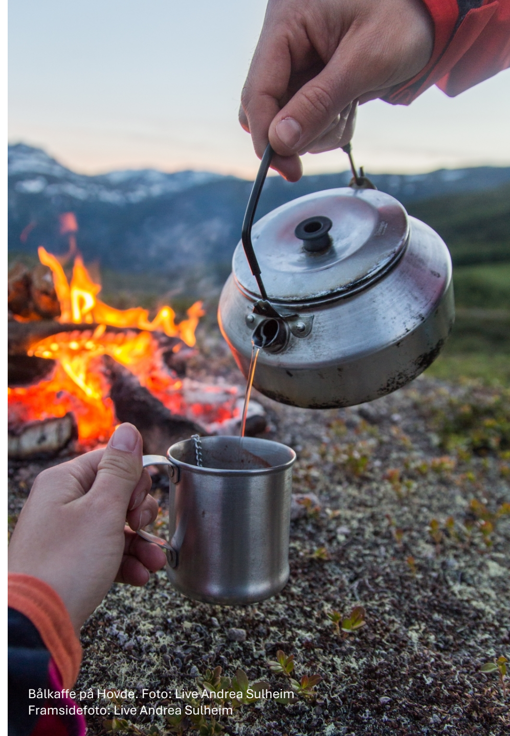
Bålkaffe på Hovde.

Denne planen er bygd opp kring satsingsområde, hovudmål og delmål. Dette er igjen knytt opp mot FN sine berekraftmål.