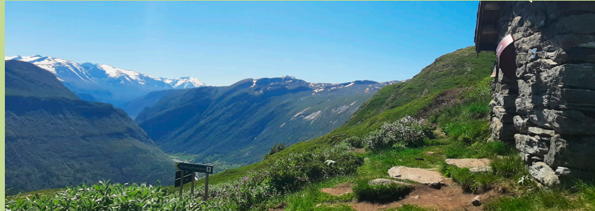
Smith-hytta, Steinhütte auf dem Weg hinauf nach Lomseggen.