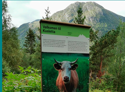
Informationstafeln auf dem Weg nach Skutlan.