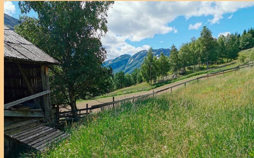
Blick von Slettom in Richtung „Bord“, woher der Name Bordvassvegen stammt.