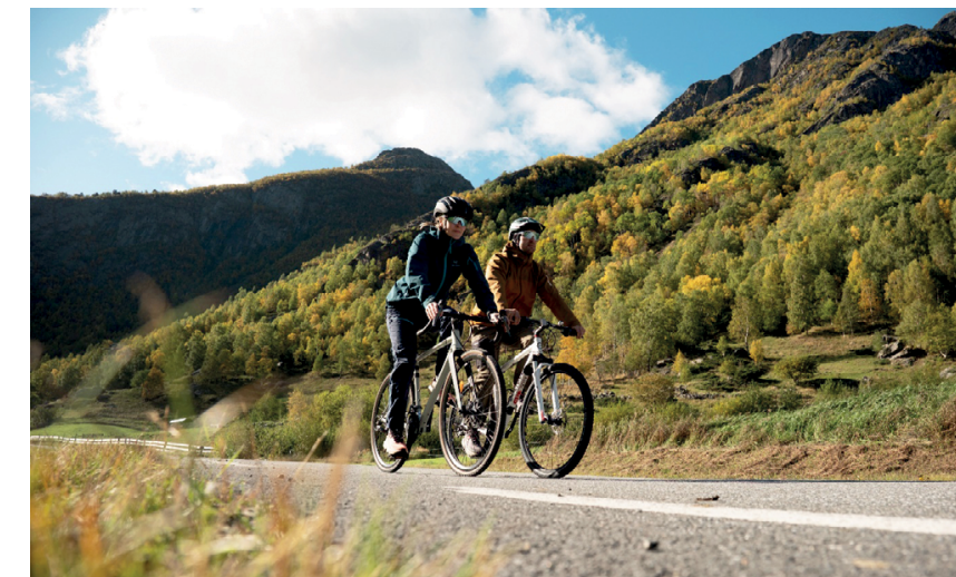
Ta deg ein sykkelstur langs den sjarmerande Solsidevegen opp til Flå / Flåklypa. | Enjoy a bike ride along the charming Solsidevegen up to Flå / Flåklypa.

1a 3 km inn på Solsidevegen kan du ta Marsteinbruvegen og Fv. 55 attende