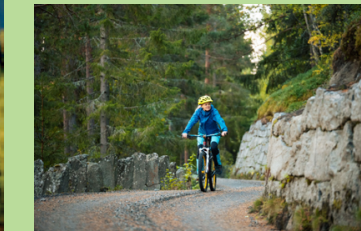
Ta ein avstikkar langs Kollavegen, mellom steinmur og stabbesteinar | Take a detour along Kollavegen, between stone walls and historic stone markers.