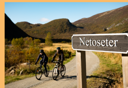
Netoseter er ei idylliske setergrend med rik kulturarv. | Netoseter is an idyllic area with a rich cultural heritage