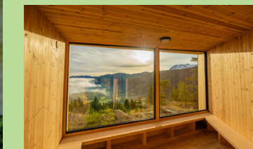
Ta gjerne ein fottur oppom dagsturhytta i Garmo | Take a detour - hike to dagsturhytta