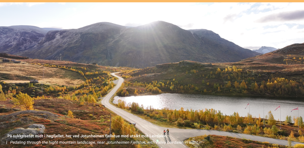
På sykkelsetet midt i høgfjellet, her ved Jotunheimen fjellstue med utsikt mot Leirdalen. | Pedaling through the high mountain landscape, near Jotunheimen Fjellstue, with Valley Leirdalen in sight.