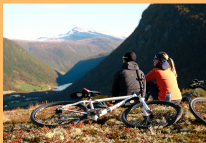
På denne turen kan du oppleve både høgfjell og tradisjonelt seterlandskap. | This tour offers a taste of both the high mountain terrain and the traditional summer farm scenery.