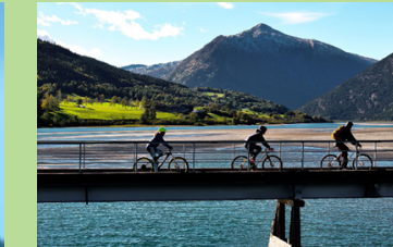
Her sykklar du over Liabrue | Cycle across Liabrue.