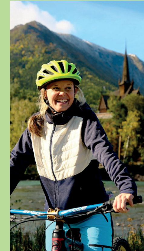
Start sykkelturen din frå Lom nasjonalparklandsby (Fossbergom). | Set off from Lom National Park Village (Fossbergom).