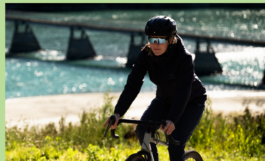
På sykkelrut langs elva Otta. | Frå sykkelsetet til snaryggane ved Glittertind

Feel free to combine this trip with accommodation at Glitterheim and a hike to Glittertinden (2452 m.a.s.l.). Park at the barrier by the national park border in Veodalen, then cycle from there to Glitterheim. Remember to check the opening hours.