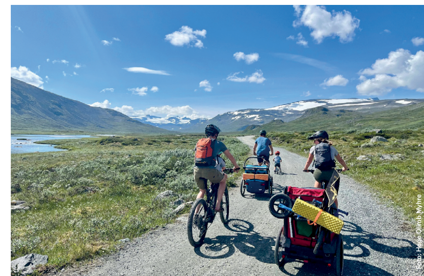
Sykkelturen inn til Glitterheim passer fint med barn eller sykkelvogn. | The bike ride to Glitterheim is perfect for families or with a bike trailer.

4a Cycle the entire route from Randsverk – a scenic, hilly gravel road winding through traditional mountain farm landscapes.