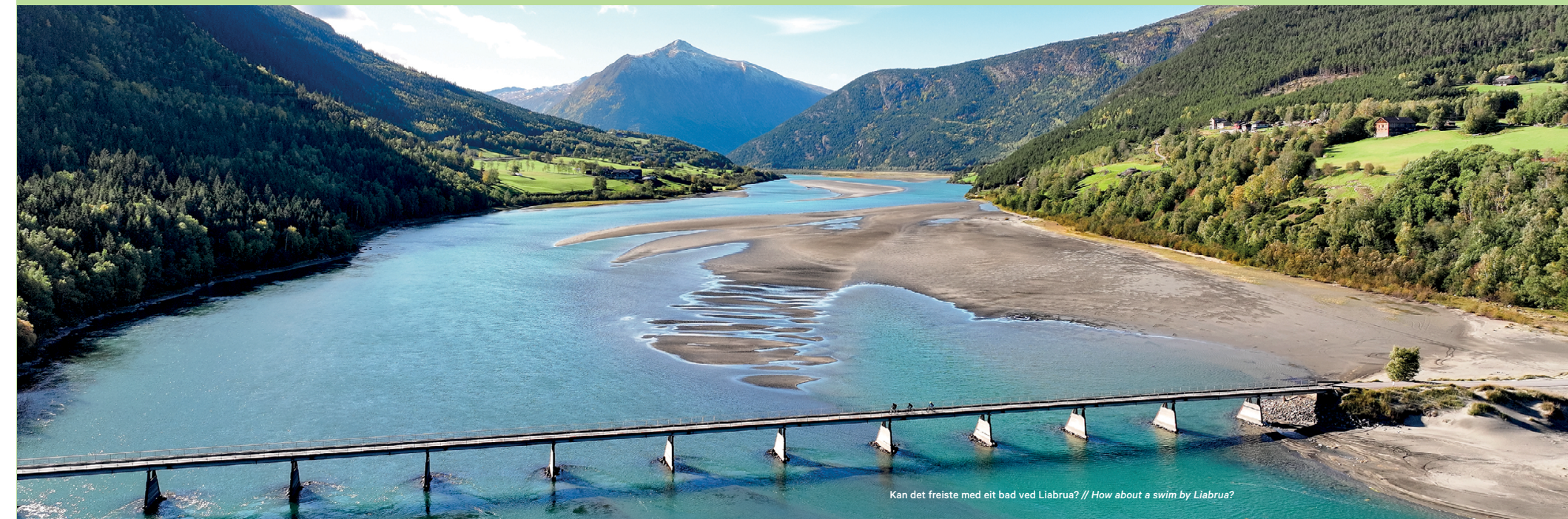
Kan det freiste med eit bad ved Liabrue? // How about a swim by Liabrue?