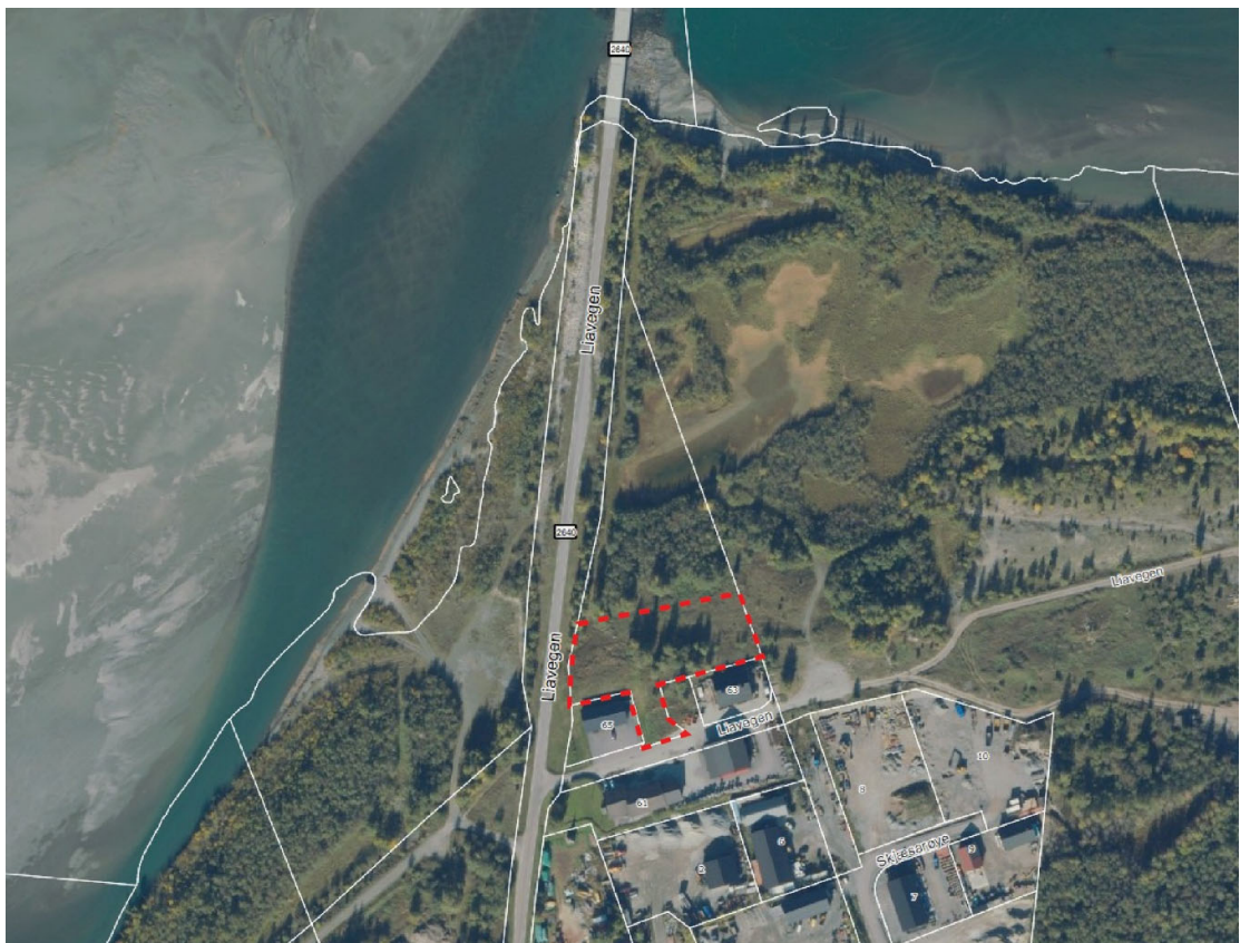
Figur 2: Flyfoto med foreslått planavgrensing - markert med raud, stipla line.

Planområdet omfattar del av éin eigedom, gbnr. 38/50, med heimelshavar Ola Steinbakke. Då området grensar til eksisterande utbygd areal, legg ein til grunn at etablert infrastruktur for vatn, avløp og energi finst i nærleiken.