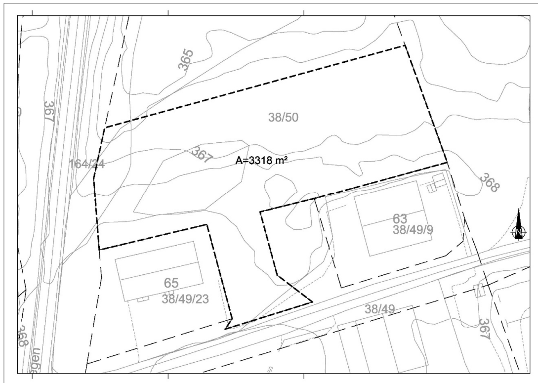
Figur 1: Foreslått planavgrensing

Planavgrensinga fylgjer eigedomsgrrensa mot sør, aust og vest. Mot nord fylgjer den formålsgrensa for felt BN_F2 med arealformål framtidig næringsverksemd.