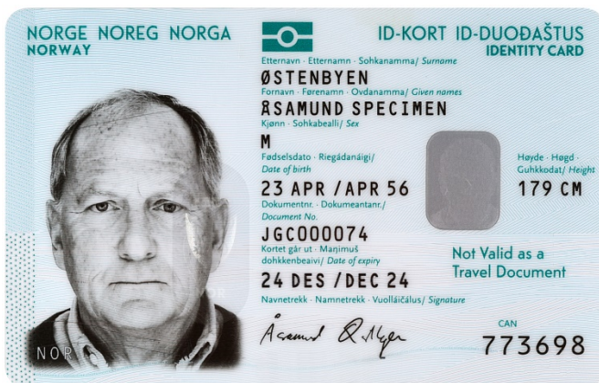
Bilde av nasjonalt ID-kort uten reiserett