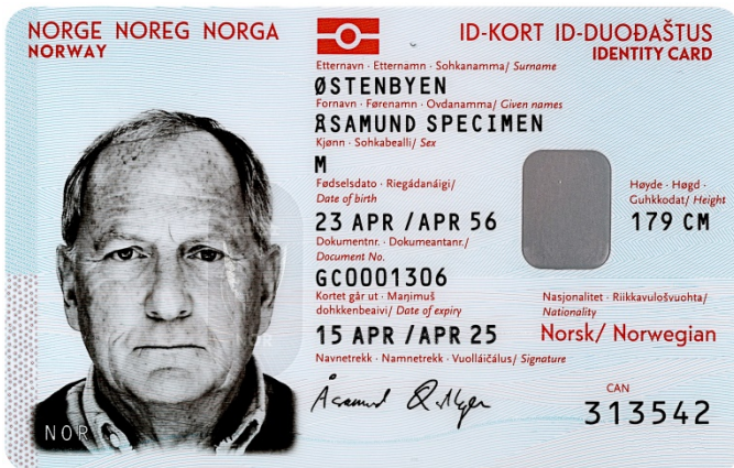
Bilde av nasjonalt ID-kort med reiserett