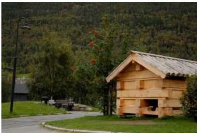
Figur 1: Labyrinthuset i Lom, ein fin leikeplass for born i sentrum