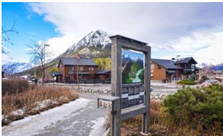
Figur 3: Informasjonstavle ved Vassvaglen