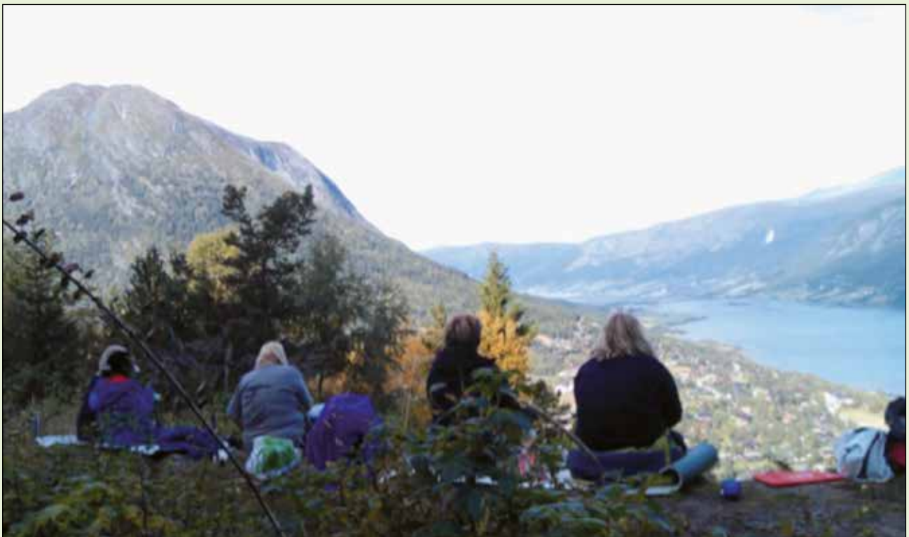
Tur til Kusletta.

Friviljugsentralen har bortimot 90 hjelparar, men treng fleire på «laget». Om du kan tenkje deg å vera med og gjera ein innsats på fredagstreffen, småbarnstreffen, besøksteneste på Helseheimen el. sjåfør, ta deg ein tur innom sentralen på ein kaffikopp og ein prat med dagleg leiar. Betalinga du får er å hjelpe medmenneske og å treffe mange spanande, flinke friviljuge.