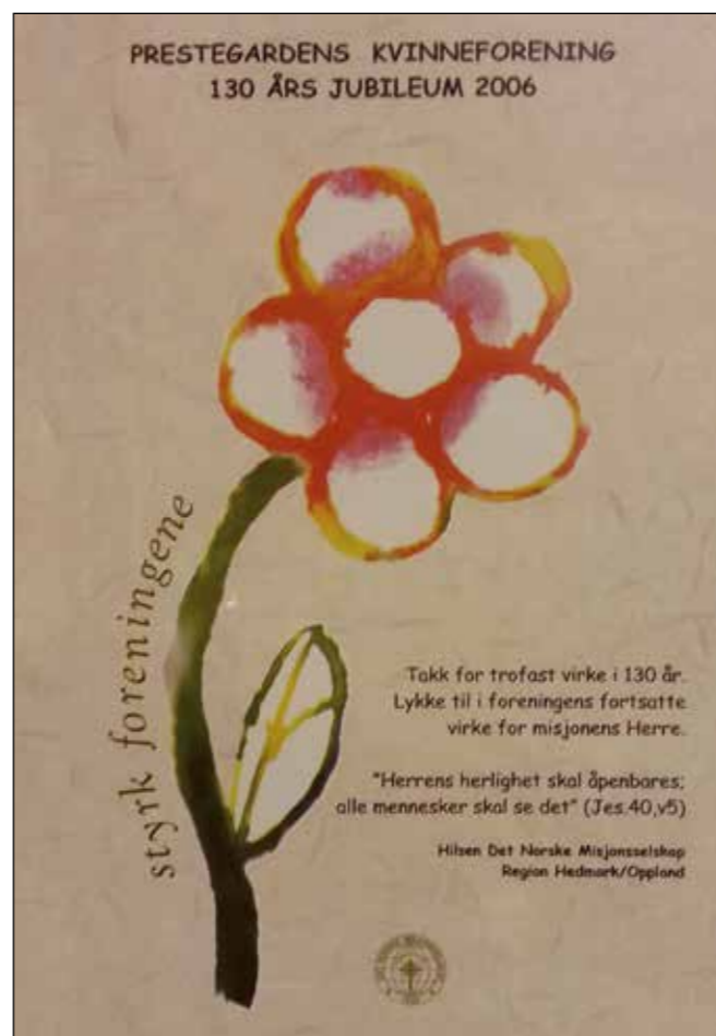
På Kyrkjelydshuset heng ein plakatar som fortel om trufast teneste gjennom meir enn 130 år.