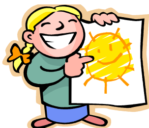
Ressursgruppe i barnehage og skule